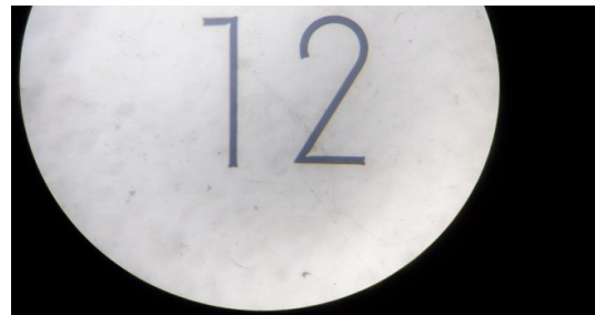
ズーム倍率4 40倍画像